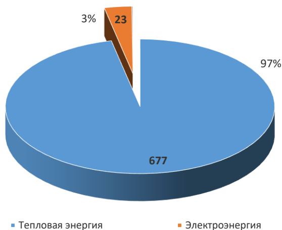
Количество энергосервисных контрактов в многоквартирных домах Москвы за 12 мес. 2018, шт

Таким образом, в 1-4 квартале 2018 года в отношении 866 многоквартирных домов заключены энергосервисные контракты по экономии электрической и тепловой энергии, из них: