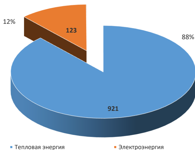
Распределение количества энергосервисных контрактов за период с 2013-2018 гг. по видам энергоресурсов

Следовательно, всего энергосервисные контракты реализуются на текущий момент в 1803 многоквартирных домах, что составляет порядка 5,4 % от общего количества многоквартирных домов в Москве, из них: